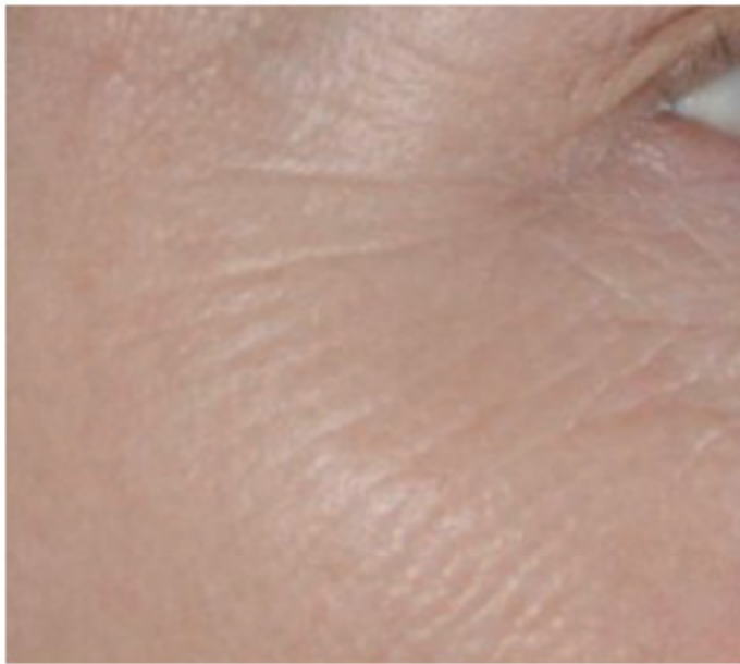
Abb. 2a: Vor IPL/Boswellia-Behandlung.