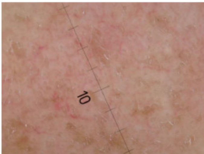
Abb. 3a: Barrierestörung vor Behandlung.