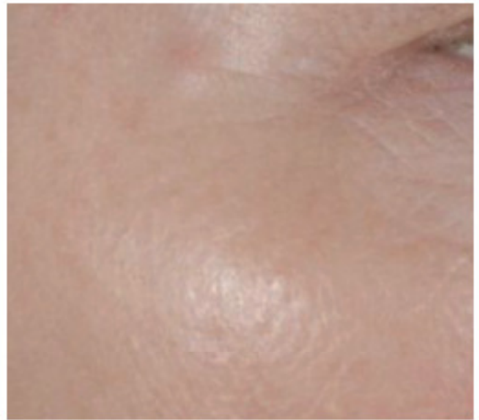
Abb. 2b: Nach IPL/Boswellia-Behandlung.